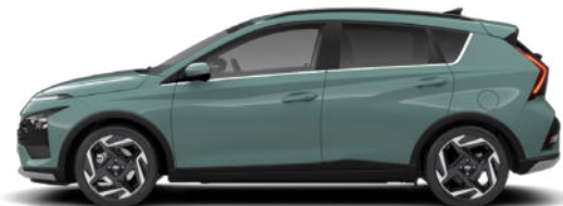
Mangrove Green Pearl Kontrastdach verfügbar