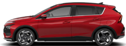
Dragon Red Pearl Kontrastdach verfügbar