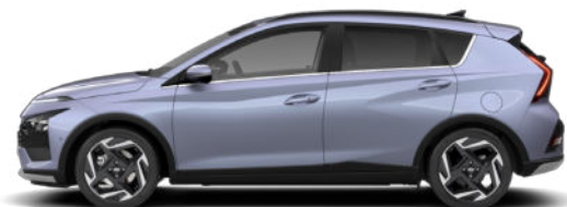
Meta Blue Pearl Kontrastdach verfügbar