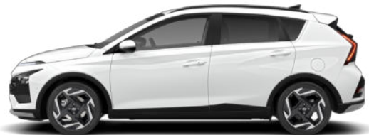
Atlas White Kontrastdach verfügbar