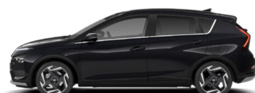
Phantom Black Pearl