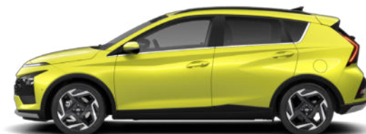
Lucid Lime Metallic Kontrastdach verfügbar