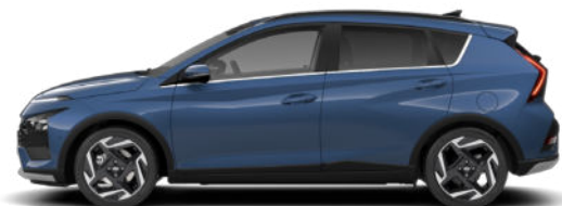
Vibrant Blue Pearl Kontrastdach verfügbar