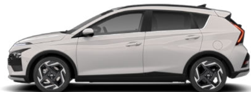
Lumen Gray Pearl Kontrastdach verfügbar