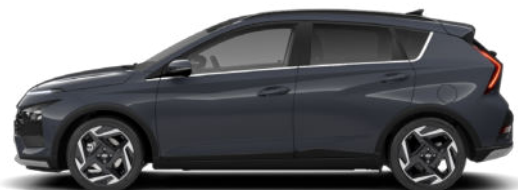
Aurora Gray Pearl